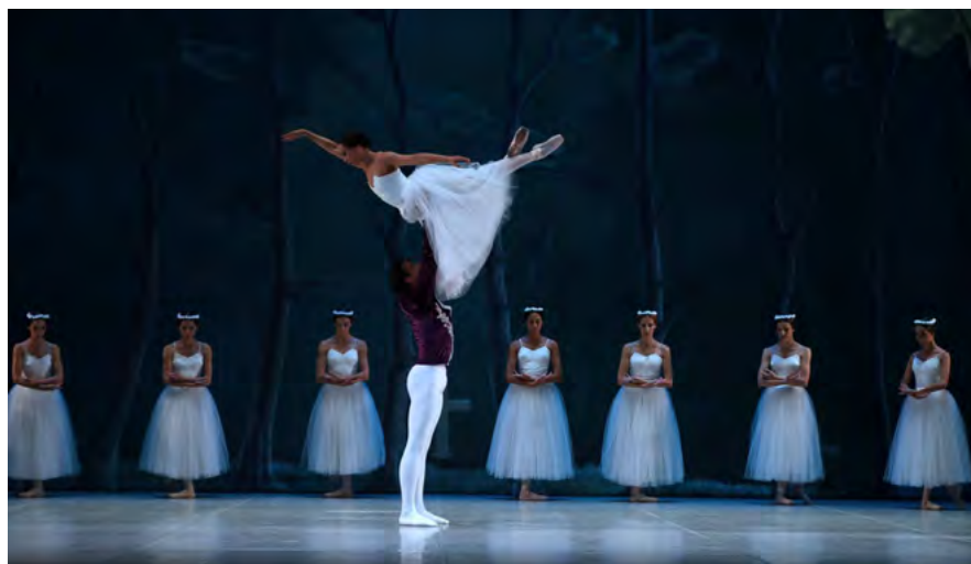
"Giselle" función benéfica del Ballet Municipal de Lima.

Ballet Municipal de Lima: Se realizó una función benéfica de la obra "Giselle" en el Teatro Municipal de Lima. Este evento se realizó el domingo 16 de abril con el apoyo de La Municipalidad de Lima y logró recolectar 600 kilos de alimentos y artículos de aseo.