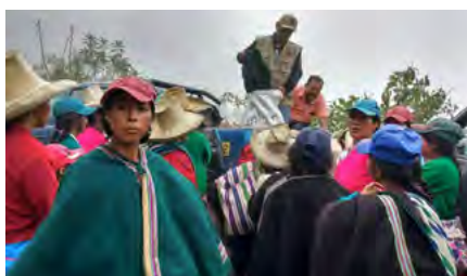
Atención en los caseríos de Lanche y de Inampampa, Piura.