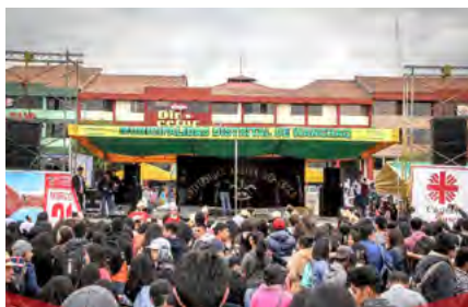
Campaña de recolección de donaciones, Cáritas Cusco y Cáritas Chuquibambilla.