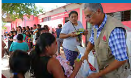
Cáritas Piura entregando desayunos y ayuda humanitaria en el caserío Encuentro de Romeros.