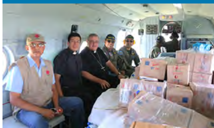
Cáritas Piura-Tumbes llevando ayuda humanitaria hacia las zonas afectadas.