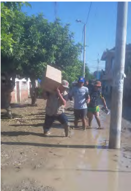
Zona afectada en Huarmey, Ancash