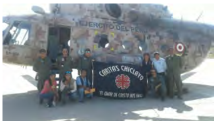
El Ejército del Perú brindó su apoyo en el traslado de la ayuda humanitaria