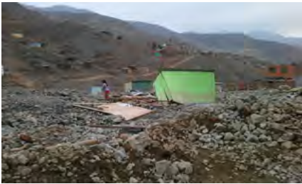
Vivienda afectada en el Anexo 22, Jicamarca, Lima.

Fuente: INDECI, fecha de corte 12 de abril. Grupos sectoriales de Agua, Seguridad Alimentaria y Nutrición, Salud, Protección y Educación en emergencias.