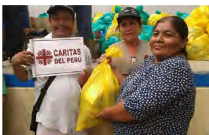
Canalización de ayuda humanitaria en Rinconada, La Libertad.