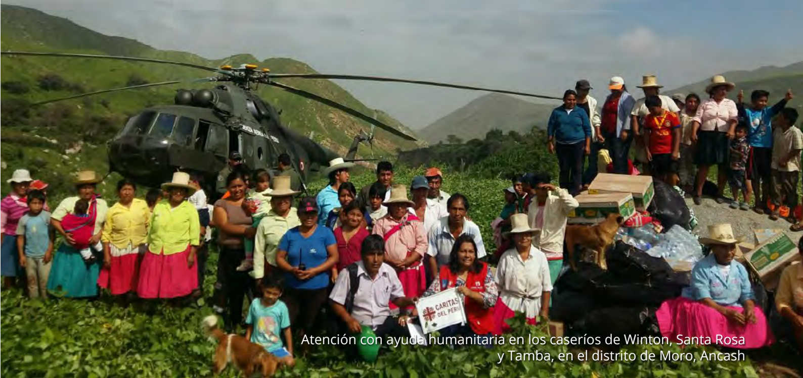
Atención con ayuda humanitaria en los caseríos de Winton, Santa Rosa y Tamba, en el distrito de Moro, Ancash