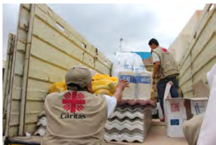
Atención humanitaria en Ica.