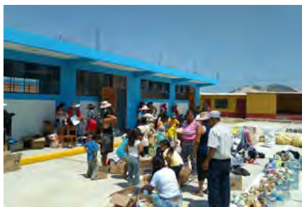
Entrega de ayuda humanitaria en Virú, La Libertad.