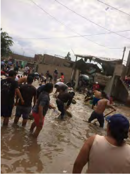
Inundación en La Tinguiña, Ica.

1,181,530 Personas afectadas (1,010,208) y damnificadas (171,322) a nivel nacional