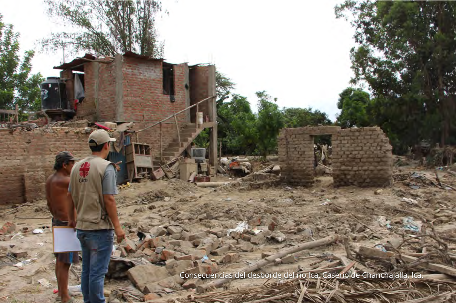
Consecuencias del desborde del río Ica, Caserío de Chanchajalla, Ica.