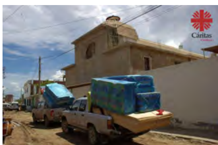
Cáritas Chiclayo llevando ayuda humanitaria a Illimo.

Isidro lanzaron un llamado a la solidaridad denominado #PerúDaLaMano (16 de marzo de 2017).