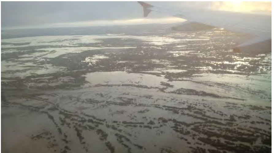
Vista aérea de la ciudad de Piura.