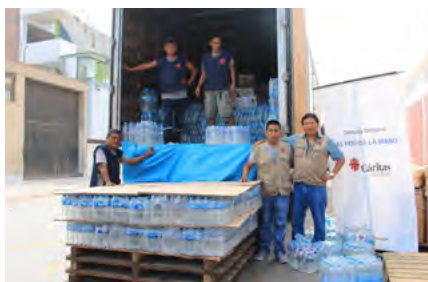
Cáritas Madre de Dios entregó 9 toneladas de ayuda humanitaria