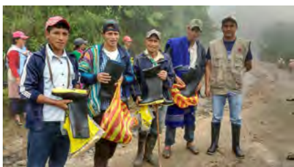
Entrega de ayuda en los caseríos de Lanche y de Inampampa, Piura.

ayuda humanitaria que fue canalizada a las Cáritas Diocesanas de Piura-Tumbes, Chulucanas, Chiclayo, Trujillo, Chosica y Chimbote.