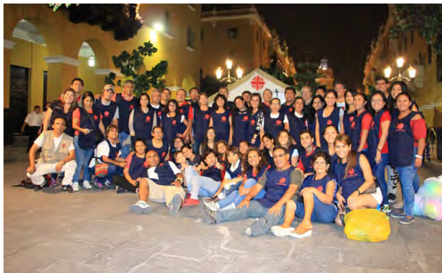
Colaboradores de Cáritas del Perú que apoyaron como voluntarios en la recolección de donaciones en concierto benéfico.

ayuda humanitaria que fue canalizada a las Cáritas Diocesanas de Piura-Tumbes, Chulucanas, Chiclayo, Trujillo, Chosica y Chimbote.