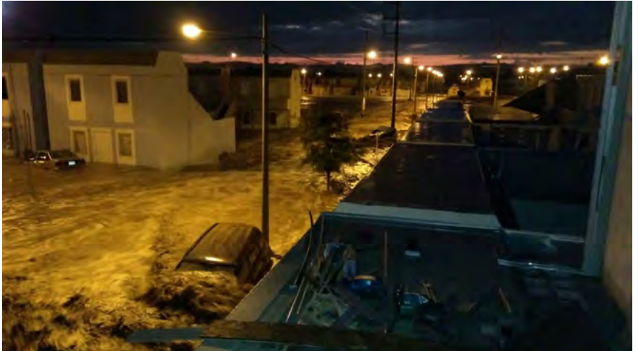
Inundación en La Tinguiña, Ica.