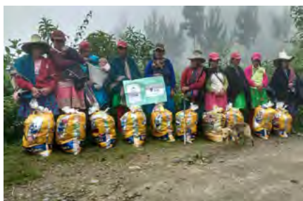
Atención en el Caserío de Lanche por Cáritas Chulucanas.