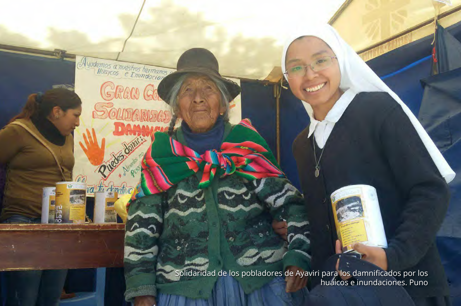
Solidaridad de los pobladores de Ayaviri para los damnificados por los huáicos e inundaciones. Puno