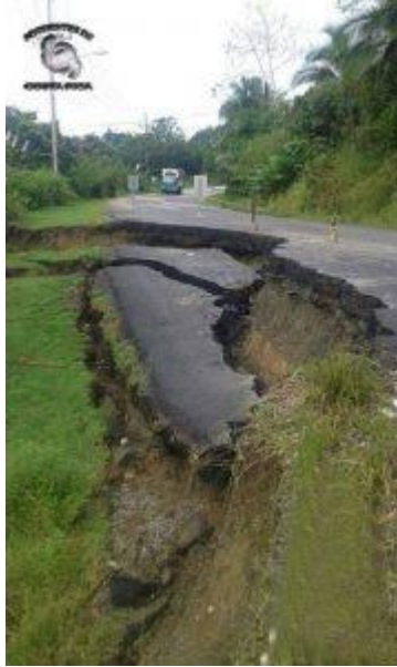
Hundimiento de carretera en la zona Sur (Golfito)