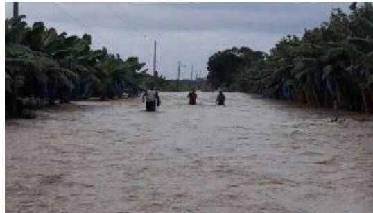
Inundaciones en la zona del Caribe