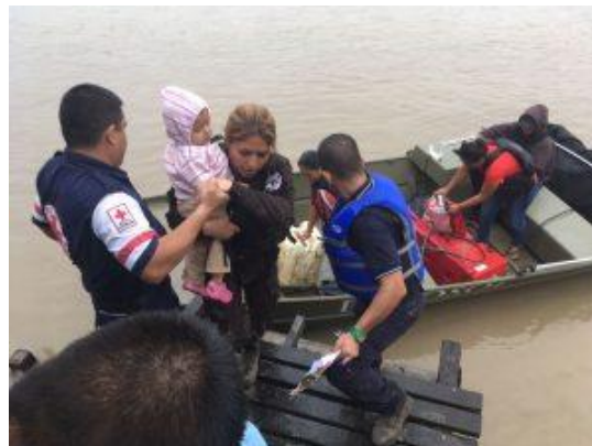
Evacuaciones por las fuerzas policiales